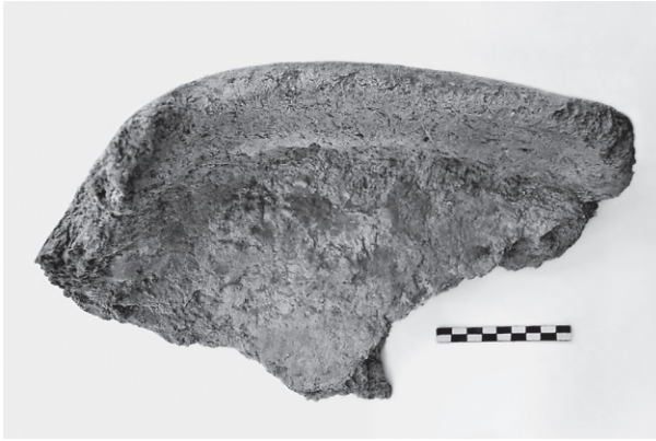
Εικ. 11. Τομή 22-84β. Μαγειρικό σκεύος-«ταψί».