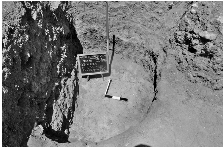
Εικ. 4. Τομή 22-84β. Ο βορειοδυτικός λάκκος.