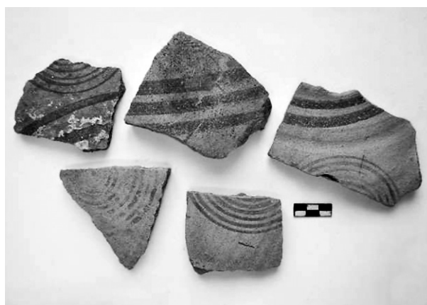
Εικ. 6. Τομή 22-84β. Όστρακα υποπρωτογεωμετρικών αμφορέων.

Στη ΒΑ πλευρά του σκάμματος, κάτω από την ταφή αλόγου και τον λιθοσωρό 2, αποκαλύφθηκε μία από τις τυπικές για το Καραμπουρνάκι ημιυπόγειες κυψελόμορφες κατασκευές η οποία, όμως, διαφοροποιήθηκε από τις υπόλοιπες ως προς το γέμισμά της 12 (Εικ. 5). Η ταφή του αλόγου και ο λιθοσωρός κατέστρεψαν το