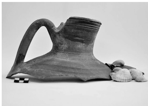
Εικ. 10. Τομή 22-84β. Οινοχόη τοπικού εργαστηρίου.

στον λάκκο, αφού προηγουμένως είχαν μαγειρευτεί και καταναλωθεί, όπως διαπίστωσε η αρχαιοζωολόγος Τ. Θεοδωροπούλου, η οποία έχει αναλάβει τη μελέτη του σχετικού υλικού. Πρόκειται, μάλιστα, για τις ίδιες ποικιλίες που συλλέγονται μέχρι σήμερα από τις ακτές του Θερμαϊκού, όπως αχιβάδες, σωλήνες, χτένια, κυδώνια, κέρατα, καλόγνωμες και πορφύρες, και που φαίνεται ότι αποτελούσαν εκλεκτά θαλασσινά εδέσματα άλλοτε, όπως και τώρα.