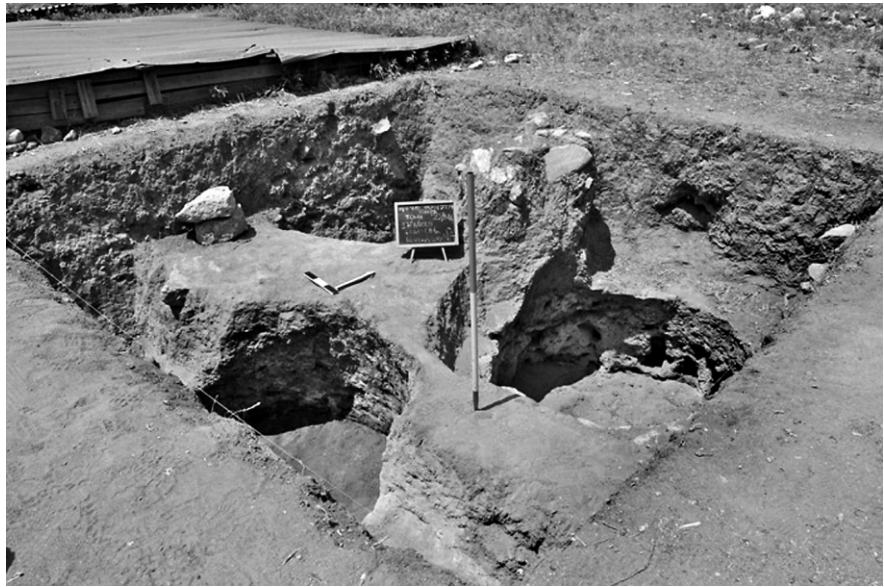
Εικ. 3. Τομή 22-84β. Γενική άποψη από νοτιοανατολικά.