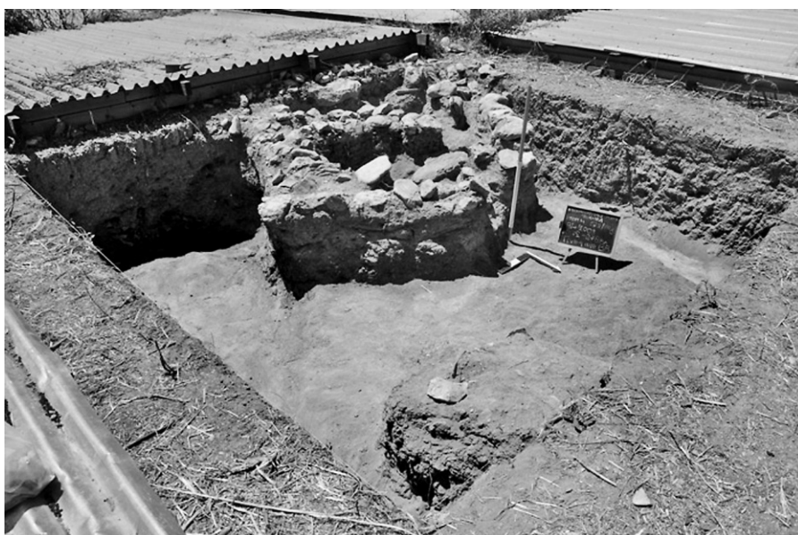
Εικ. 2. Τομή 22-84γ. Γενική άποψη από βορειοανατολικά.

νότιο τμήμα της τομής κατά το 2008 5 , έδειξε την ύπαρξη υποθεμελίωσης δύο τοίχων. Πρόκειται για την τυπική στο Καραμπουρνάκι υποθεμελίωση με αργούς λίθους, η οποία στη συγκεκριμένη περίπτωση πατά επάνω σε καστανό χώμα, κάτω από το οποίο βρίσκεται το σκούρο καστανό και σκληρό καθαρό χώμα, πάχους περίπου 0,40 μ. Κάτω από το τελευταίο εντοπίστηκε, όπως συνήθως, το λευκό φυσικό χώμα της περιοχής 6 . Οι δύο τοίχοι φαίνεται να σχηματίζουν γωνία και η κατεύθυνσή τους είναι ΝΔ-ΒΑ (τοίχος 1) και