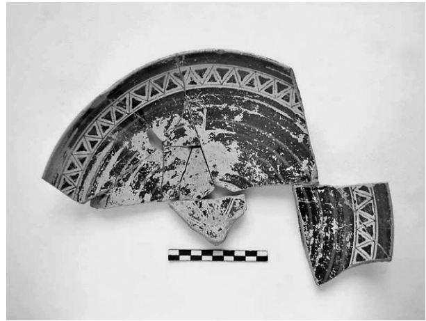
Εικ. 8. Τομή 22-84β. Πινάκιο από ιωνικό εργαστήριο.

Στον ίδιο λάκκο παρατηρείται μεγάλη ποικιλία και στις κατηγορίες της εισαγμένης κεραμικής, καθώς αντιπροσωπεύονται τόσο οι εμπορικοί αμφορείς με ποικίλες προελεύσεις όσο και διάφορα σχήματα διακοσμημένων αγγείων «πολυτελείας». Ανάμεσά τους ξεχωρίζουν τα όστρακα υπο-πρωτογεωμετρικών πιθαμφορέων διακοσμημένων με ομόκεντρα ημικύκλια, συστάδες γραμμών και πλατιές ταινίες από την Εύβοια, καθώς και μεγάλο συγκολλημένο τμήμα από έναν αττικό αμφορέα SOS, ο οποίος φέρει στον ώμο χαρακτή επιγραφή (ΧΕΑΣΔΜΑ:). Αρκετά θραύσματα προέρχονται επίσης από άλλους αττικούς αμφορείς SOS, από χιώτικους και λέσβιους αμφορείς και μία βάση ίσως κλαζομενιακού αμφορέα. Τα περισσότερα δείγματα της λεπτής κεραμικής έχουν προέλευση από εργαστήρια της ανατολικής Ελλάδας και ορισμένα φέρουν γραπτή διακόσμηση, ενώ άλλα είναι μελαμβοφή ή ερυθροβαφή, όπως το τμήμα μιας μελαμβοφούς οινοχόης, τμήματα ερυθροβαφούς οινοχόης, όστρακο πρώιμου χιώτικου κάλυκα και άλλα. Ιδιαίτερη μνεία πρέπει να γίνει σε τρία όστρακα από πινάκια-καρποδόχες που συνανήκουν με θραύσματα δύο πινάκων γνωστών από παλιότερες ανασκαφικές περιόδους και από αρκετά απομα-