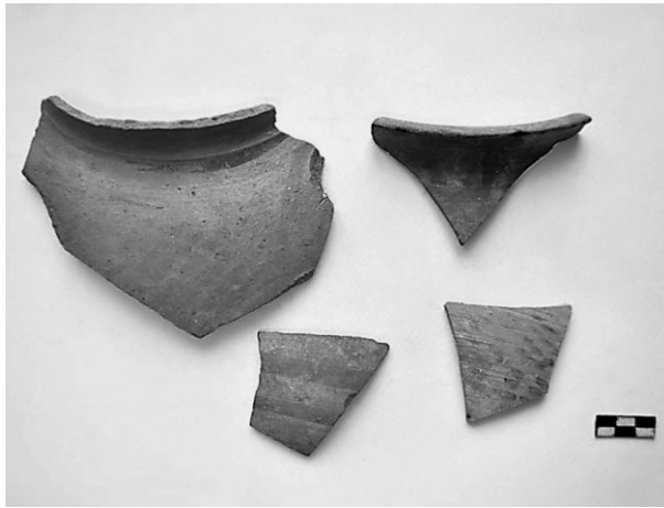
Εικ. 7. Τομή 22-84β. Όστρακα αγγείων «ασημίζουσας» κεραμικής.

των γεωμετρικών μοτίβων (Εικ. 7), οι μεγάλες οινοχόες και πρόχοι με καστανό επίχρισμα ή με γραπτή ταινιωτή διακόσμηση, καθώς και πολλά όστρακα αγγείων της «ωοκέλυφης» κεραμικής με έμφαση στο σχήμα της άποδης κύλικας και της πρόχου. Ορισμένα σχήματα παρουσιάζουν ιδιαίτερα στοιχεία, όπως δύο ασυνήθιστου σχήματος οριζόντιες λαβές, μια θηλεωτή από φιαλόσχημο αγγείο και μια διχαλωτή από αρύταινα. Επιπλέον, για πρώτη φορά διαπιστώθηκε η ύπαρξη χαραγμάτων και διακόσμησης με την τεχνική rouleting στο εσωτερικό ορισμένων ωοκέλυφων οστράκων.