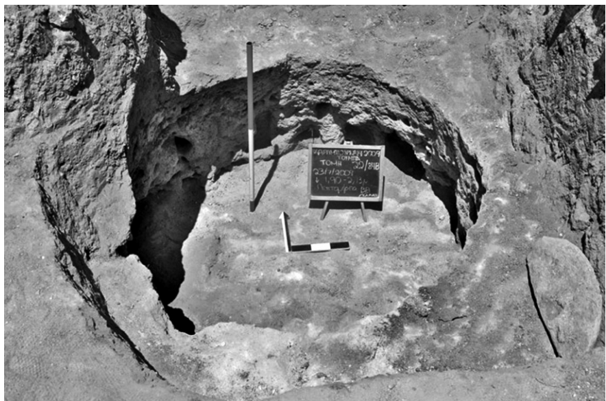
Εικ. 5. Τομή 22-84β. Το βορειοανατολικό υπόσκαπτο.