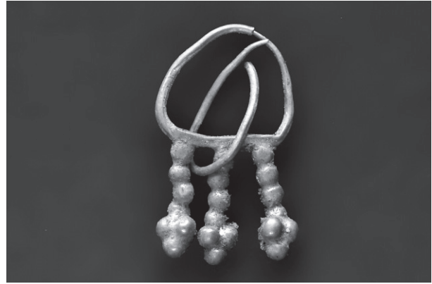
Εικ. 12. Τομή 22-84β. Χρυσό ενώτιο.

(Εικ. 11) από τον τρίτο λάκκο της τομής 22-94β. Αυτό ανήκει, μάλιστα, στον ίδιο τύπο με παρόμοιο ενώτιο που βρέθηκε κατά την ανασκαφή του 2008, στον χώρο του εργαστηρίου μεταλλουργίας στην τομή 23-12δ. Αποτελούνται και τα δύο από συρμάτινο κρίκο από όπου κρέμονται τρία στελέχη διακοσμημένα με σφαιρίδια, που απολήγουν σε κοκκιδωτό καρπό, ανακαλώντας τα ομηρικά «τρίγλινα μορόεντα» 16 . Παρά τις εμφανείς ομοιότητες, τα δύο ενώτια διαφέρουν κάπως ως προς το μέγεθος και τη μορφή τους 17 .