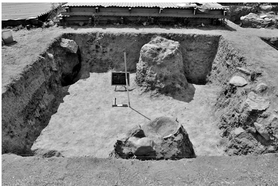
Εικ. 1. Τομή 22-85α. Γενική άποψη από βόρεια.