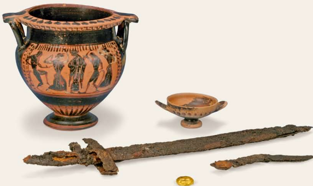
Κτερίσματα αρχαϊκής ταφής στον Δρυμό Θεσσαλονίκης.