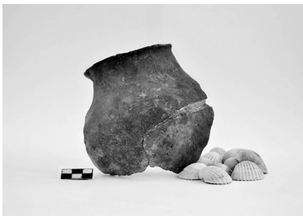
Εικ. 9. Τομή 22-84β. Μαγειρικό σκεύος-χύτρα.

μνεία αξίζει να γίνει στον μεγάλο αριθμό οστράκων και τμημάτων από τις τοπικές μεγάλου μεγέθους οινοχόες (Εικ. 10). Τα αγγεία αυτά παρουσιάζουν ποικιλία ως προς τη διαμόρφωση του χείλους και των λαβών καθώς και ως προς τη διακόσμησή τους. Το στόμιο μπορεί να είναι στρογγυλό και οπισθότμητο ή ελαφρά τριφυλλόσχημο, οι λαβές κυκλικής (μονές ή διπλές) ή ταινιωτής διατομής. Ορισμένες οινοχόες διακοσμούνται με την εναλλαγή πλατιών φωτεινών πορτοκαλλί και σκούρων καστανών ταινιών, ενώ άλλες καλύπτονται ολόκληρες με καστανό επίχρισμα. Συχνά φέρουν συστάδες από οριζόντιες αυλακώσεις στο χείλος και τον ώμο. Στην προκειμένη περίπτωση, πολλά θραύσματα οινοχών βρέθηκαν ανακατεμένα με σωρούς οστρέων και εντοπίστηκαν συγκεντρωμένα κοντά στα τοιχώματα του λάκκου, δηλώνοντας έτσι ότι τα όστρακα πρέπει να αποτελούσαν το περιεχόμενο των σκευών αυτών.