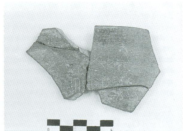
1. Νεότερος λιθινός αγωγός νερού ανάμεσα στους τοίχους της τομής 23-15β. 2. Τοίχοι που σχηματίζουν οικιακούς χώρους με ορθογώνια κάτοψη στην τομή 23-3α. 3. Πιθεύνας και λείψανα τοίχων στην τομή 23-15α. 4. Αποσπασματικά σωζόμενος μεσοκορινθιακός αμφορέας με ζωφόρους ζώων από την τομή 23-2γ. 5. Θραύσματα χρηστικών αγγείων με εγχάρακτα εμπορικά σύμβολα (graffiti). 6. Τμήμα αμφορέα με εγχάρακτη καρική επιγραφή από την τομή 23-3α.