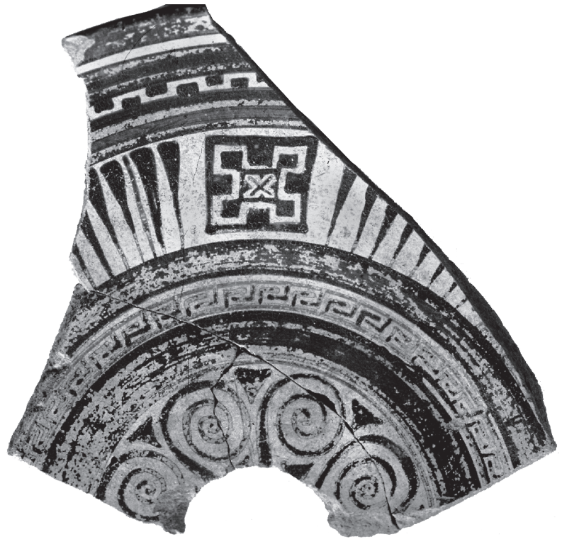
Εικ. 1. Θραύσμα καρποδόχης Ανατολικής Ελλάδας, αρ. K97.1007.

διακόσμηση (Εικ. 1). Στην εξωτερική επιφάνεια σώζονται τέσσερις μαύρες ταινίες, στοιχείο συνηθισμένο στη διακόσμηση της κατηγορίας αυτής. Στο εσωτερικό, η άκρη του χείλους κοσμεύεται με μαύρη ταινία, ενώ η διακόσμηση του σώματος αποτελείται από ζώνες με παρεμβαλλόμενες ταινίες ανάμεσά τους. Από το χείλος προς το κέντρο του αγγείου, η διάταξη της διακόσμησης ακολουθεί την εξής σειρά: α) ιώδης ταινία, β) λευκή ταινία ανάμεσα σε μελανές γραμμές, γ) εναλλαγή ιώδους-μελανής-ιώδους ταινίας, δ) λευκή ταινία διακοσμημένη με μελανά ορθογώνια που εμφανίζονται εναλλάξ πάνω και κάτω δημιουργώντας ένα οδοντωτό μοτίβο, ε) μελανή-ιώδης-μελανή-ιώδης ταινία (οι τελευταίες τρεις απολεπισμένες), και στ) ζώνη με μετόπες γεωμετρικών κοσμημάτων (διατηρείται μία), οι οποίες χωρίζονται με οκτώ ακτίνες, όπως φαίνεται από το σωζόμενο τμήμα (Εικ. 1). Δεξιά της σωζόμενης μετόπης σώζονται επτά ακτίνες, από τις οποίες η τρίτη από αριστερά αποδίδεται ως γραμμή, ίσως λόγω της έλλειψης χώρου. Στη μετόπη αυτή απεικονίζεται ένα τετράγωνο, το περίγραμμα του οποίου ορίζεται με μελανό χρώμα, με το εσωτερικό του αφημένο στο λευκό επίχρισμα, που αποτελεί και το βάθος πάνω στο οποίο τοποθετείται με μελανό χρώμα, η εσωτερική διακόσμηση του τετραγώνου. Από το μέσον της κάθε πλευράς του τετραγώνου και προς το εσωτερικό του,