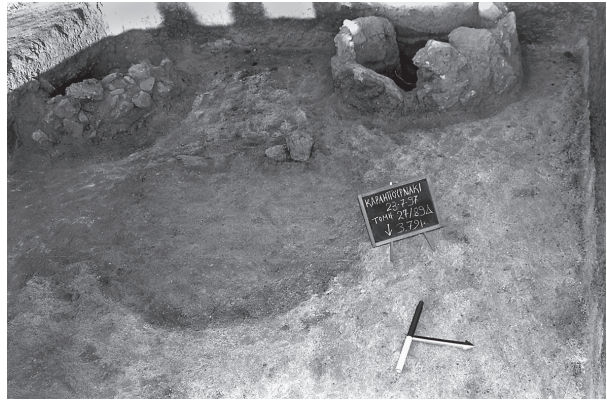
Εικ. 2α-β. Άποψη της τομής 27/89δ με το υπόσκαπτο της βορειοδυτικής γωνίας, στις 23/7/1997.

βορειοδυτικής γωνίας και σε βάθος περίπου δύο μέτρων από τη σημερινή επιφάνεια (Εικ. 2α-β). Τα όστρακα αποτελούσαν μέρος του γεμίσματος της ημιυπόγειας κυψελόμορφης κατασκευής, η οποία εντάσσεται σε ένα σύνολο παρόμοιων κατασκευών που έχουν εντοπιστεί διάσπαρτα στην αρχαία εγκατάσταση της επιφάνειας της τούμπας στο Καραμπουρνάκι και θεωρούνται πλέον βασικό χαρακτηριστικό της 7 . Αυτό που διαφοροποιεί το συγκεκριμένο υπόσκαπτο από τα περισσότερα του χώρου, είναι ότι διατηρούσε μέρος του υπέργειου τμήματός του, το οποίο οριζόταν από αργούς λίθους στην περιφέρειά του 8 (Εικ. 2β). Τα θραύσματα της καρποδόχης, όπως και το σύνολο του υλικού που βρέθηκε μέσα στον χώρο αυτό, αποτελούν απορρίμματα τα οποία απέθεσαν εκεί μετά, προφανώς, από την εγκατάλειψη της αρχικής χρήσης του. Το ενδιαφέρον, σχετικά με το βορειοδυτικό υπόσκαπτο, είναι πως αποτελεί ένα από τα λίγα μέχρι σήμερα, που θα μπορούσαν να αποκαλεστούν ‘δίδυμα’ 9 . Στην προκειμένη περίπτωση, η ημιυπόγεια κατασκευή όχι μόνο βρίσκεται σε επαφή με το υπόσκαπτο που εντοπίστηκε στο κέ-