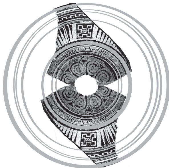
Εικ. 4. Διαδικασία τρισδιάστατης αποκατάστασης της καρποδόχης αρ. K97.1007 (© Τμήμα Πολιτιστικής Τεχνολογίας, Ε.Κ. «Αθηνά» / Καραμπουρνάκι, Πανεπιστημιακή ανασκαφή).

Κρίνοντας από τη διάμετρο του μεταλλίου, όπως προκύπτει και από την τρισδιάστατη αποκατάστασή του (Εικ. 3 & 4), οι έλικες δεν θα πρέπει να συνεχίζονταν για πολύ ακόμη προς το κέντρο. Ο εναπομείναν χώρος επίσης, δεν επιτρέπει την απόληξή τους σε μία ισομεγέθη έλικα. Άλλωστε τα σωζόμενα τμήματα των τριγώνων που διακρίνονται στο κάτω τμήμα τους, υποδηλώνουν ότι κάπου εκεί θα πρέπει να