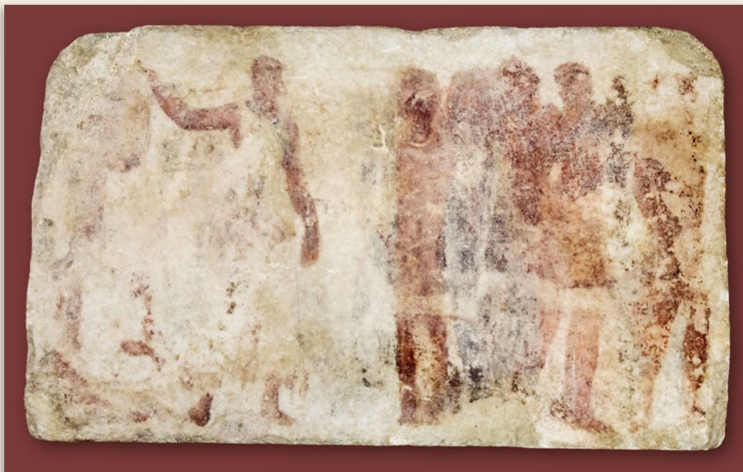
Αρχαία Αγορά Θεσσαλονίκης. Μαρμάρινη πλίνθος με γραπτό διάκοσμο από ιερό ελληνιστικής εποχής