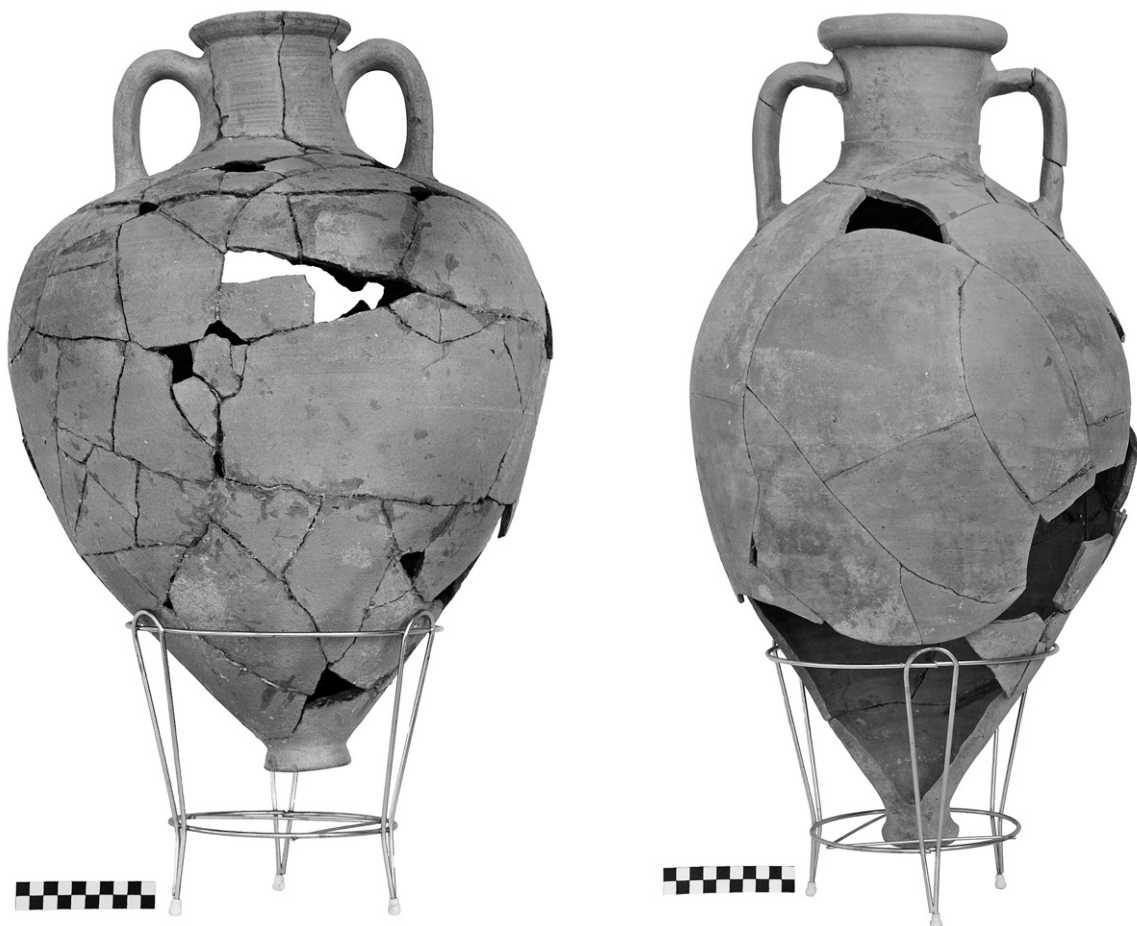
Εικ. 5α-β. Τομή 27-89β. Εμπορικοί αμφορείς από το Ν υπόσκαπτο.

αμφορείς. Οι κύριοι τύποι περιλαμβάνουν έναν σαμιώτικο, ορισμένους νοτιοανατολικού Αιγαίου, τύπου Μένδης και βορειοανατολικού Αιγαίου, ενώ φαίνεται ότι όλοι χρονολογούνται στα τέλη του 6 ου με αρχές του 5 ου αι. π.Χ., είναι δηλ. υστεροαρχαϊκοί 10 . Δίνεται, επίσης, η εντύπωση της μετάβασης από τους αμφορείς της ανατολικής Ελλάδας, που κυριαρχούσαν μέχρι και τον 6 ο αι. π.Χ., στους αμφορείς του βορειοανατολικού Αιγαίου, που αρχίζουν να τους αντικαθιστούν στη συνέχεια. Η παρατήρηση αυτή σχετίζεται με την παρόμοια εικόνα που διαπιστώνεται όχι μόνο στο Καραμπουρνάκι, αλλά και γενικότερα στην ευρύτερη περιοχή του βόρειου Αιγαίου.