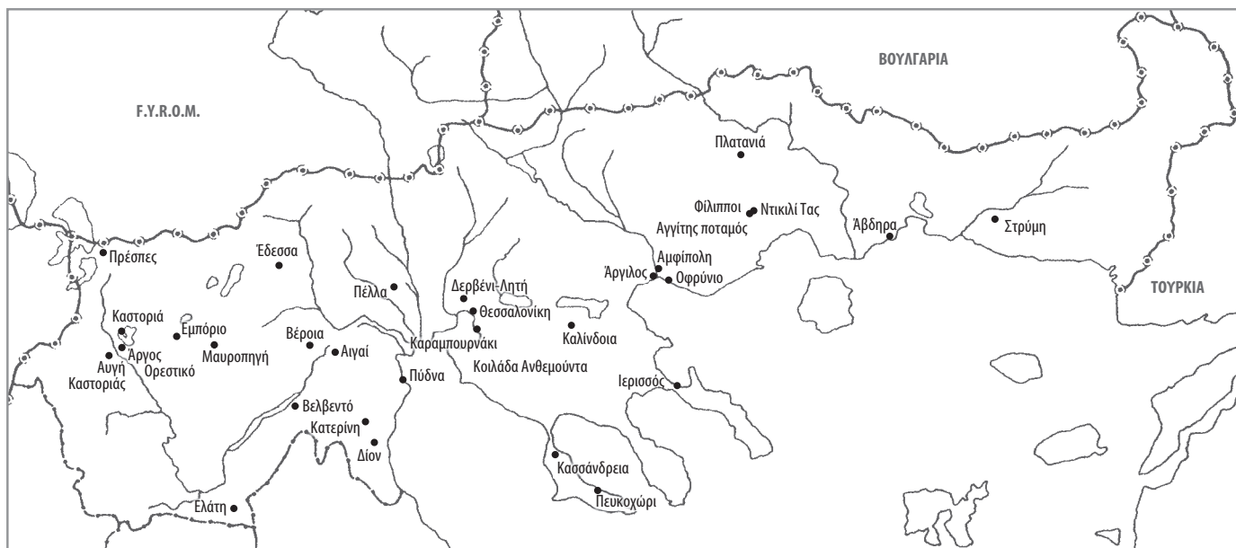
Χάρτης των περιοχών της Μακεδονίας και της Θράκης που αναφέρονται στο ΑΕΜΘ 27, 2013.