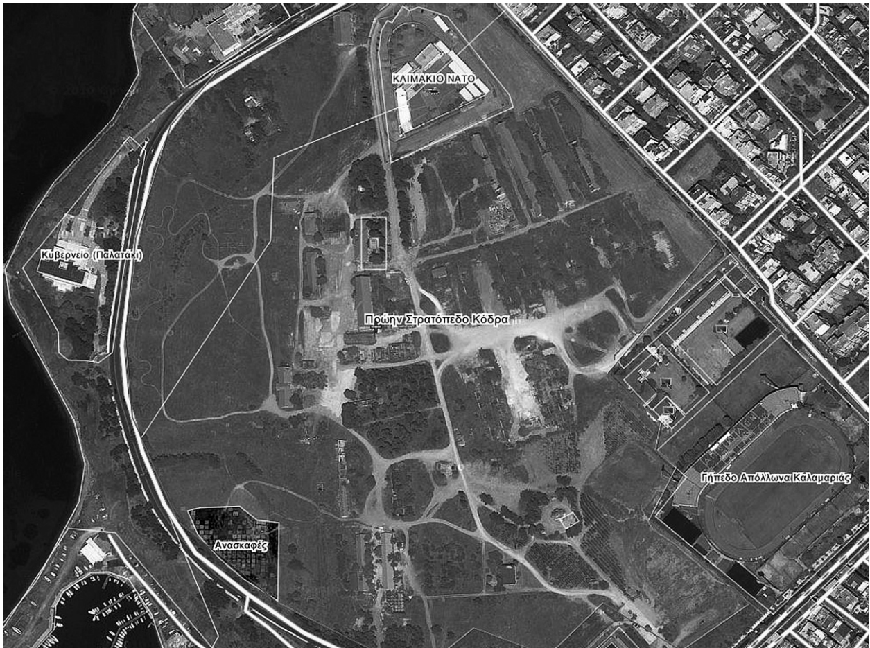
Εικ. 1. Καραμπουρνάκι: αεροφωτογραφία του αρχαιολογικού χώρου και της περιοχής του.

για το αρχαιοβοτανολογικό υλικό) 3 . Με αφορμή, μάλιστα, τη συμπλήρωση 20 χρόνων συστηματικής ανασκαφικής έρευνας και παρουσίας της πανεπιστημιακής ομάδας στο Καραμπουρνάκι, προγραμματίζεται η έκδοση ενός συλλογικού τόμου-λευκώματος με κείμενα και φωτογραφίες που θα προβάλλουν την πορεία και τα πορίσματα της ανασκαφής έως σήμερα, καθώς και τη σημασία του ανασκαπτόμενου οικισμού στην περιοχή του Θερμαϊκού κόλπου κατά τη γεωμετρική και κυρίως την αρχαϊκή περίοδο.