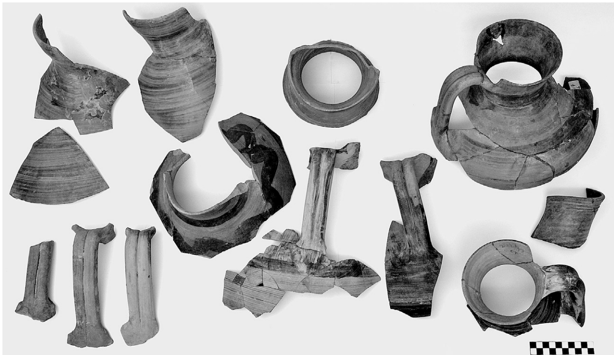
Εικ. 3. Τομή 27-89δ. Οινοχόες τοπικών εργαστηρίων από το βορειοδυτικό υπόσκαπτο.

η αποσπασματική εικόνα που είχε διαμορφωθεί πέρις παρέμεινε, καθώς δεν πρόκειται για ολόκληρα αγγεία που έσπασαν κατά την πτώση τους στο υπόσκαπτο. Φαίνεται ότι πρόκειται για απορρίμματα, τα οποία θα μπορούσαν να είχαν πεταχτεί πιθανόν όλα μαζί. Η κεραμική παρουσιάζει μεγάλη ποικιλία και χρονολογείται στο σύνολό της στην αρχαϊκή εποχή. Πρόκειται κυρίως για ντόπια χρηστικά σκεύη, χωρίς να απουσιάζουν και τα επεισοδικά παραδείγματα. Όσον αφορά στην εγχώρια παραγωγή ξεχωρίζουν τα ωκέλυφα, οι οινοχόες, τα γκριζα, τα μαγειρικά αγγεία, τα ιγδία, τα πιθάρια και τα λεγόμενα «ταψιά» (Εικ. 3). Από τα εισηγμένα αγγεία διακρίνονται οι ιωνικές κύλικες και λίγα κορινθιακά, ενώ υπάρχουν και χαρακτηριστικά μεμονωμένα παραδείγματα αγγείων της ανατολικής Ελλάδας, όπως μια καρποδόχη και ένας λέβητας 5 . Ευδιάκριτη είναι και η παρουσία των εμπορικών αμφορέων, ανάμεσα στους οποίους ξεχωρίζουν οι αττικοί SOS, χιώτικοι, σαμιακοί, κλαζομενιακοί και κορινθιακοί 6 . Ενδιαφέρον είναι ότι στην πλειονότητά τους ανήκουν χρονολογικά στο δεύτερο μισό του 7 ου και στο πρώτο